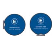
EASYDISC FLEX MEDIUM M