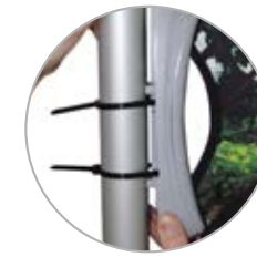
Kabelbinder M L