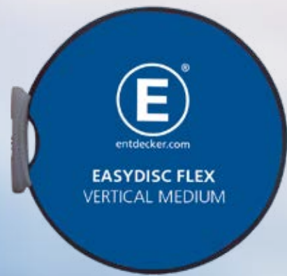
EASYDISC FLEX MEDIUM VERTICAL

bedruckt, ist sie auch als Hinweisschild bestens geeignet. Guerilla-Marketing-Aktionen macht dieser Werbeträger gerne mit – denn mit Saugnäpfen oder Magneten findet die Easydisc Flex nahezu überall Halt, ohne Spuren zu hinterlassen.