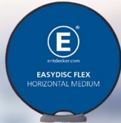
EASYDISC FLEX MEDIUM HORIZONTAL