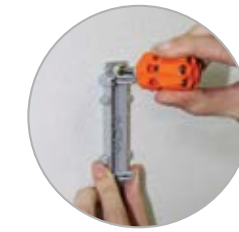
Schrauben M L